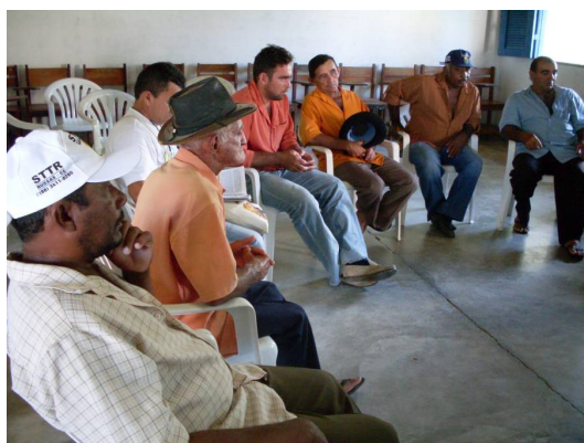
FIGURA 2. Reunião de planejamento de associados das comunidades em conflito ambiental para criação de uma contra-proposta ao DNOCS em junho de 2009.

Quanto ao movimento de resistência comunitária à expansão das obras do Perímetro Irrigado Tabuleiro de Russas, a partir da observação participante na comunidade, foi possível acompanhar as atividades da Comissão de Planejamento (Figura 2) para o desenvolvimento de uma nova proposta. As comunidades Lagoa dos Cavalos, Sussuarana, Peixe e Bananeiras têm criado estratégias locais que favoreçam o modo de vida tradicional.